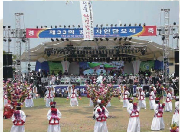
⑤慈仁端午祭 (重要無形文化財第44号) 자인 단오제

市場では野菜、魚、パン、果物、靴、衣類など、様々な物が販売されていて、慶山市民の台所として多くの買い物客でにぎわっている。