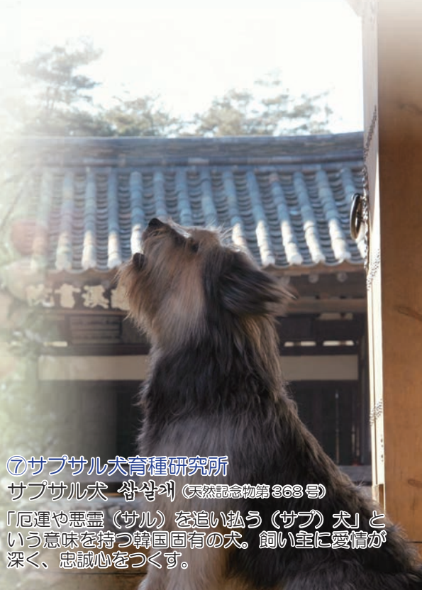
⑦サブサル犬育種研究所