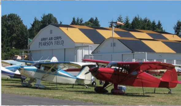
1905年開港のピアソン飛行場は現在アメリカで操業されている一番古い空港です。