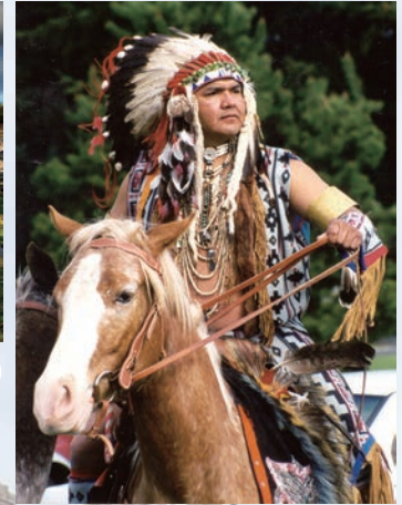
写真(左)開拓当時を伝えるバンクーバー砦(右)先住民ネズパース族の祭り